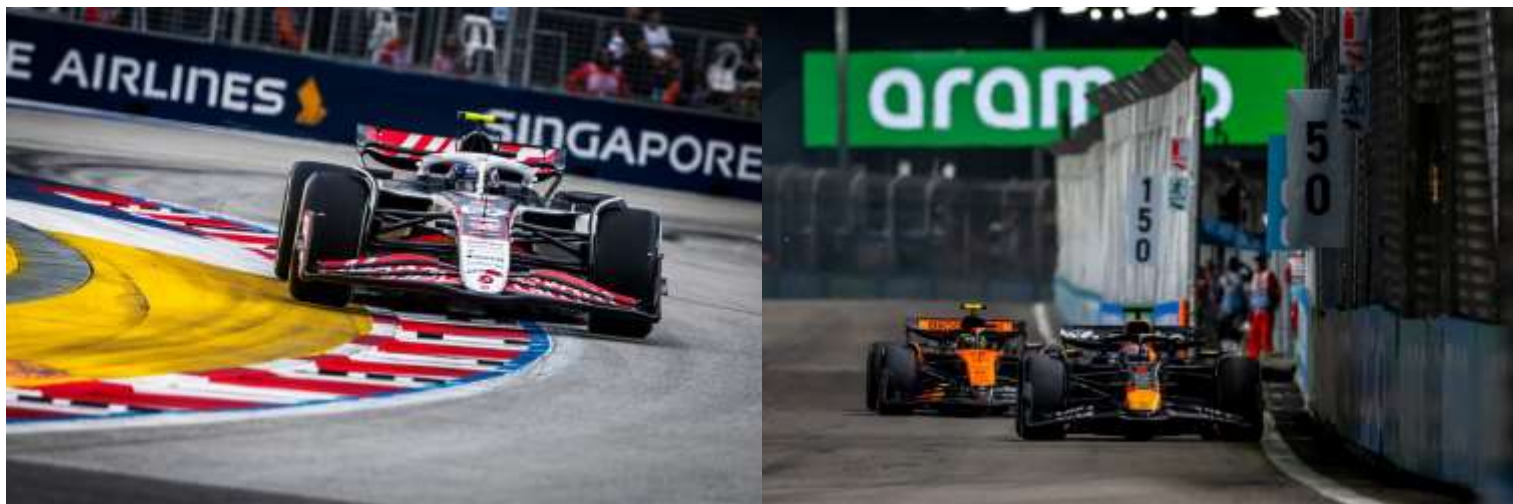
ชม รอบ SPRINT RACE + QUALIFYING

**เดินทางด้วยตนเอง เข้าร่วมงาน FORMULA 1 SINGAPORE GRAND PRIX 2026**