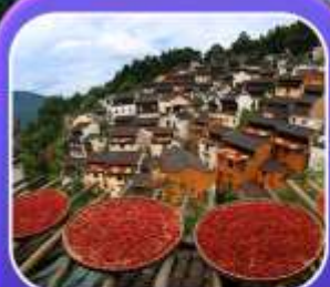
"หมู่บ้านทองหลิง"

หุบเขาเทวดาฉงเซี่ยนถู่ หมู่บ้านที่ตั้งอยู่ริมหน้าผา • หมู่บ้านโบราณทองหลิง ป่าสนน้ำชิงซาน • ล่องเรือทะเลสาบซีหู • ถนนโบราณตุ๋นเจ้อ • ชมแสงสีที่ อุ๋นนี่โจว