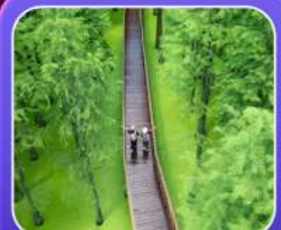
"ป่าสนชิงซาน"