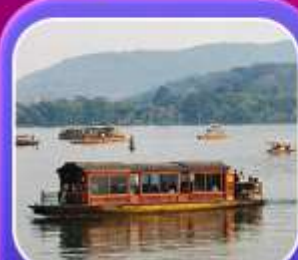
"ล่องเรือทะเลสาบซีหู"